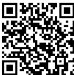
44. 麻醉药品和第一类精神药品购用许可—— 延续